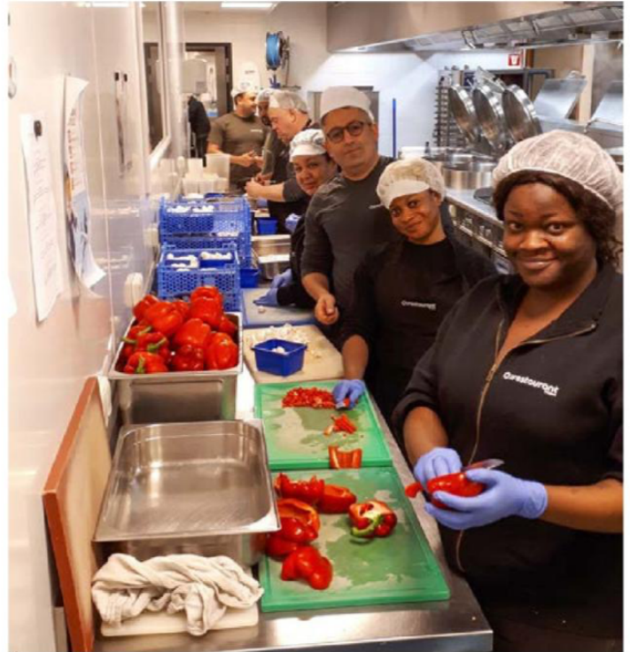
Medewerkers van Ateljee bereiden de kerstmaaltijden

Honger heeft men het hele jaar door. Daarom financiert VOG ook tijdens het jaar maaltijdvouchers. In ruil voor een voucher krijgen mensen in armoede een maaltijd in één van de sociale restaurants van Ateljee, in Het Toreken en 't Oud Postje in Gent. De maaltijd bestaat uit soep, een (eventueel vegetarisch) hoofdgerecht en water. Deze door VOG betaalde maaltijdbonnen