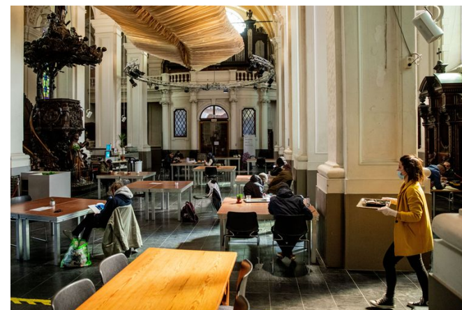
In de Parnassuskerk op de Oude Houtlei kunnen daklozen nu overdag terecht, ver uit elkaar (Wannes Nimmegeers)