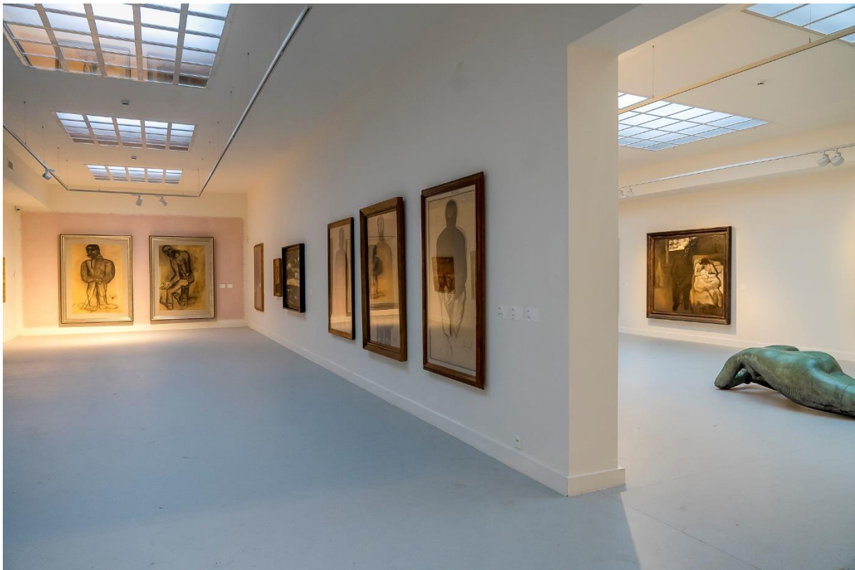
Expositieruimte uit 1934 opgetrokken naast de woning met atelier. Voorbeeldig gerenoveerd om het werk van Permeke te ontvangen.

experimenteerde met nieuwe bouwtechnieken in zijn tuinwijken en in woning De Beir in Knokke. In Jabbeke geen betonskelet, gewoon een baksteenconstructie.