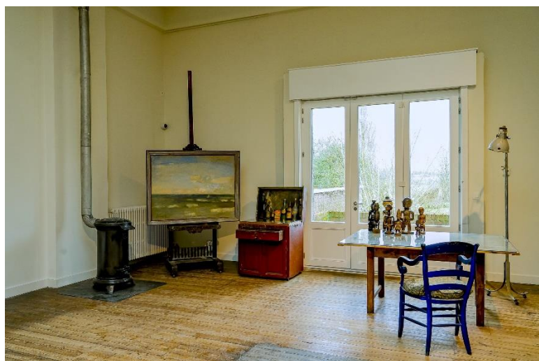
Trapruimte naar schildersatelier met robuuste borstwering. Atelier met raam richting tuin en landschap