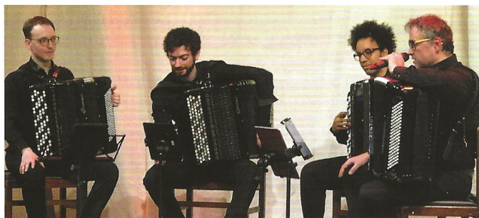
Het Quatuor Aeolina tijdens recentste aperitiefconcert (maart 2022)

Rc Gent, gecharterd in 1927, mag dit jaar 95 kaarsjes uitblazen. De club heeft in al die jaren een niet onaardige lijst van sociale en culturele initiatieven bijeengesprokkeld. Dat Rc Gent sinds lange tijd geïnteresseerd is in muziek in al haar vormen, blijkt ook uit de archieven van de club. Deze band met muziek werd dan ook wel eens bestempeld als 'A never ending story'!