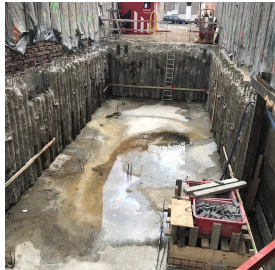
Rooseveltlaan 25 mei