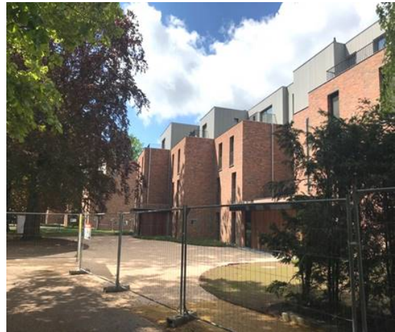
Antares in Eeklo op 1/05/2020; binnen toch nog 1,5 maand werk !

Ik heb gelukkig in deze woelige corona tijden steeds kunnen doorwerken. (“almost (?) business as usual ” met een paar sfeerfoto’s) Echter familiaal hebben we daardoor nog steeds geen echte bubbel gemaakt, want ik ben thuis het risico. We hebben op de 2 werven (in Gent op de Rooseveltlaan en Antares in Eeklo) steeds kunnen doorwerken, want wij werken met kleine(re) aannemers. Het zijn vooral de grote(re) aannemers die volledig gestopt waren. Wij hebben wel moeilijkheden ondervonden van planning en coördinatie, van enig materiaal tekort (beton, tegels uit Italië, sanitair uit Duitsland,...) en toch 1 werfploeg die gedurende een paar weken in quarantaine werd geplaatst. Aan iedere medaille is een keerzijde : ze werken door maar ze nemen het op de werf echt niet nauw met de opgelegde veiligheidsregels ! Afstand ? , maskers ? , extra hygiëne ? ,..... : soms echt onbestaand. Ik was en ben dus het risico thuis. Toch wel een maand achterstand op de planning opgelopen, met dus een uitstel van de voorziene oplevering van 19 appartementen, met dus klanten-eigenaars die er wel allemaal enigszins begrip voor hebben maar dan toch worden geconfronteerd met hun vroegere verkochte eigendom, opgezegde huur, ... waar zij dan toch ook een oplossing voor moeten kunnen vinden. Cathy daarentegen vindt het (zoals zovelen onder jullie) zeer moeilijk om moeder , kinderen en vooral kleinkinderen (6+1!) nog steeds niet te kunnen zien en “knuffelen (vooral dit laatste)”.